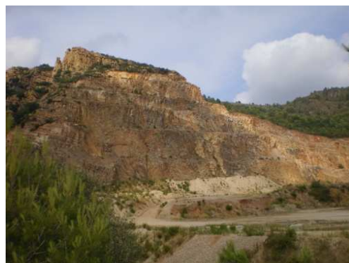
En nuestro camino, en la izquierda una cantera, y luego a medida que nos acerquemos a Artana, cambiaremos el pinar por olivos.