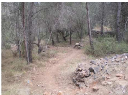
Luego un sendero fácil y cómodo (600 m. aprox), únicamente destacable por algunos pasos a diferente nivel que habrá que ir despacio y con cuidado.