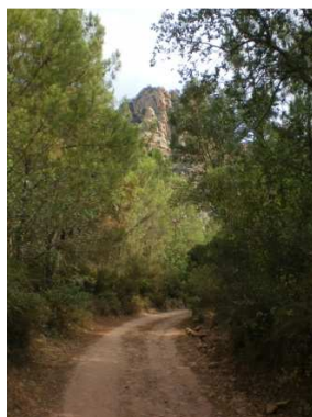
A medida que nos acerquemos, ya serán visibles las Peñas.