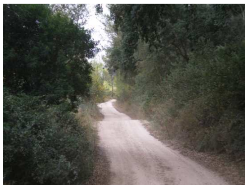
El camino hacia Artana, aunque en ascensión continua no tiene excesiva pendiente: 8 % de media