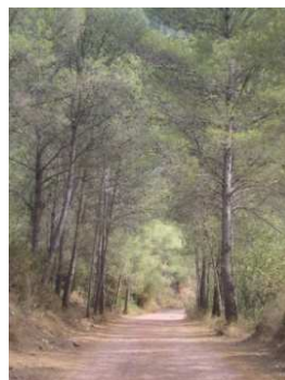
Después de volver a pasar por una zona de huertos y otro sendero (que si que será el último), ya entraremos en la Rambla de Artana