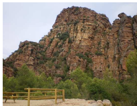
En el Km. 7,2 Las Peñas, junto a un pequeño merendero.