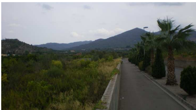
Salida de Onda. A la izquierda el Calvario, más a la derecha el Montí.