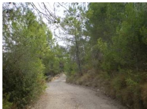
Hasta el kilómetro 4,1 aún estaremos en los huertos. A partir de entonces, pasaremos a un pequeño bosque.