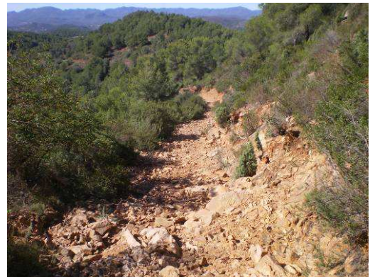
El descenso será por sendero (que parece un revuelto de rocas), descenso durante 650 m. pendiente máxima 16 %. Es el único tramo de senda.