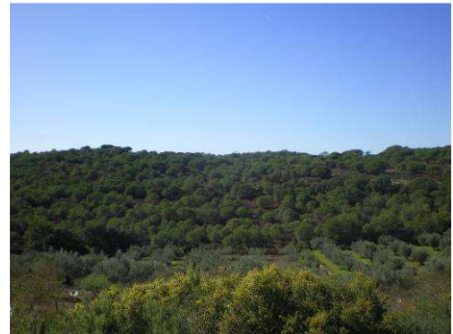
A los 8,5 km. ya estaremos en la meseta, a más de 400 m. de altura.