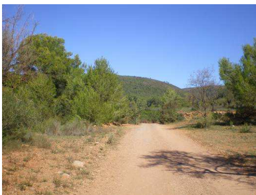
La vuelta vuelve a ser por camino rodeado de campos de cultivo.