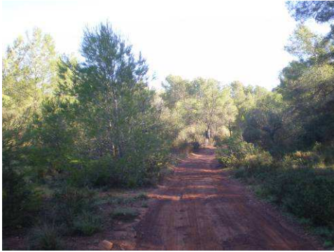
La ruta se inicia sin dificultad, por camino rodeado de campos de cultivo entremezclados con pinar.