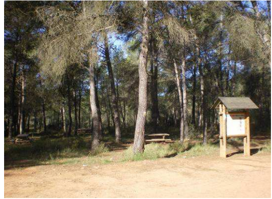
A los 3,6 km. aparece la "entrada" al parque municipal