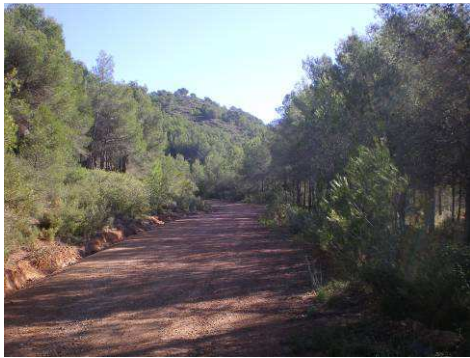
La ascensión será continua pero fácil (por pista), la pendiente máxima es del 11 %