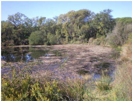
La balsa de la Dehesa, y la microreserva de flora: encontraremos varios carteles didácticos (sobre la flora local)