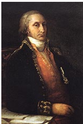
Imagen 4: Pintado por Goya

El origen de esta cerámica se remonta a finales del S. XVIII. Un destacado hombre de la ilustración llamado Antonio Raimundo Ibáñez de origen galaico-asturiano, gran amigo de Godoy, al que utilizó en algunos momentos para llevar a cabo sus negocios fundó, en el lugar de Sargadelos, al norte de la provincia de Lugo, un complejo industrial (una fundición) que fue la primera siderurgia de España. Esta fundición aprovechaba la fuerza hidráulica y la riqueza de los montes de alrededor, aunque dio mucho