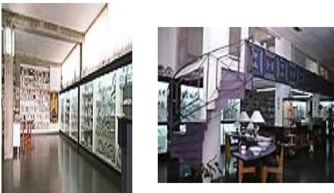
Imagen 13: Galería de Santiago