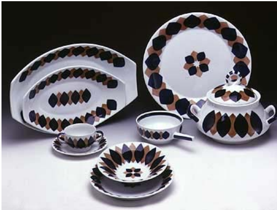
Imagen 9: Vajilla con los colores básicos

El color rojo que fue incorporado mas tarde no se le da tratamiento de cubierta, pues no aguanta las temperaturas tan altas y hay que aplicarlo después del vitrificado, por lo que se usa sólo en las figuras decorativas, en los servicios de mesa pues no aguantaría los lavados continuos.