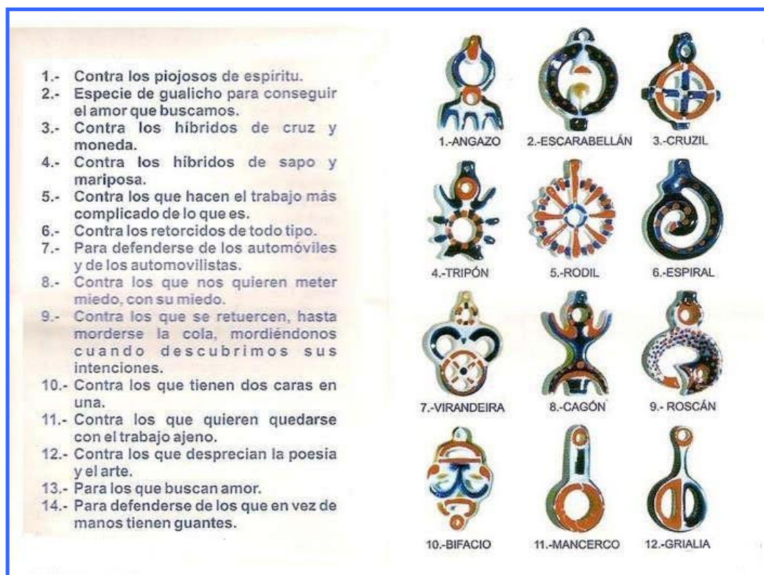
Imagen 1: Amuletos

Alguno de estos amuletos casi siempre, es la primera pieza de Sargadelos que tenemos, y la que nos empieza a meter el gusanillo de conocer la cerámica, a la que más tarde le daremos tanta importancia.