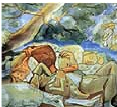
Imagen 19: La Siesta