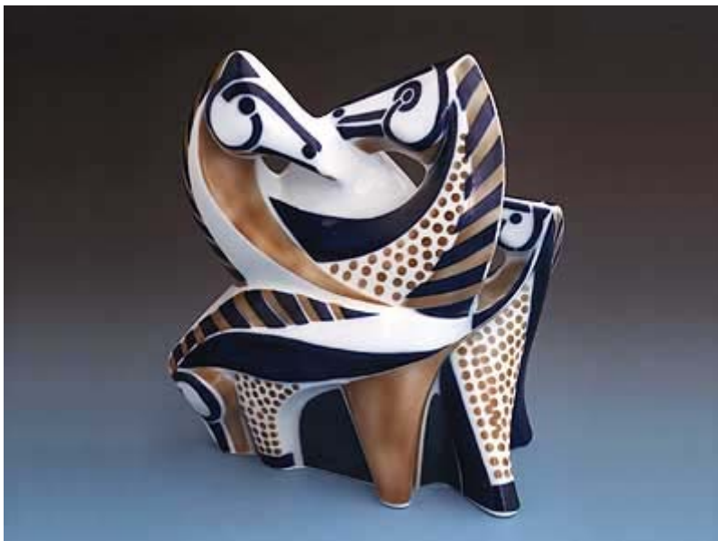
Imagen 11: Caballos de la nueva etapa de Sargadelos

Para el diseño de las piezas, los diseñadores de Sargadelos se inspiran en las tradiciones y los cultos gallegos, y en su nueva etapa las formas vanguardistas tienen un gran protagonismo, pues el Laboratorio de Formas siempre mantuvo un sistema totalmente abierto a la evolución de todas las ideas con una sola limitación: LA ETICA.