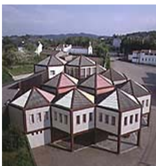
Imagen 18: Vista general

La colección se sigue incrementando día a día