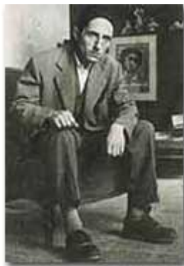
Isaac Díaz Pardo

En 1949, en el lugar del Castro de Samoedo (provincia de A Coruña ) el artista e intelectual Isaac Díaz Pardo, que había abandonado su dedicación a las artes plásticas comenzó como ceramista y creó una fabrica, llamada Cerámicas del Castro, en la que en sus inicios hacían series muy limitadas, de originales de artistas, únicamente con tierra gallega; su idea era utilizar los depósitos de Caolín de Sargadelos aun en plena explotación, y de la que se obtiene una pasta fina y translúcida de gran dureza y blancura.