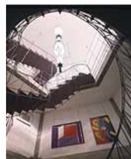
Imagen 16: Cúpula