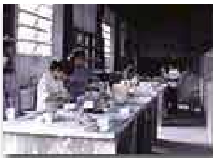
Fábrica La Magdalena