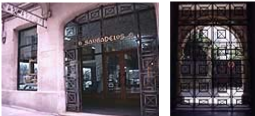
Imagen 14: Galería de Barcelona

Fuera de Galicia están en: Barcelona, Madrid, Sevilla, Milán y OPorto. Son realmente interesantes.