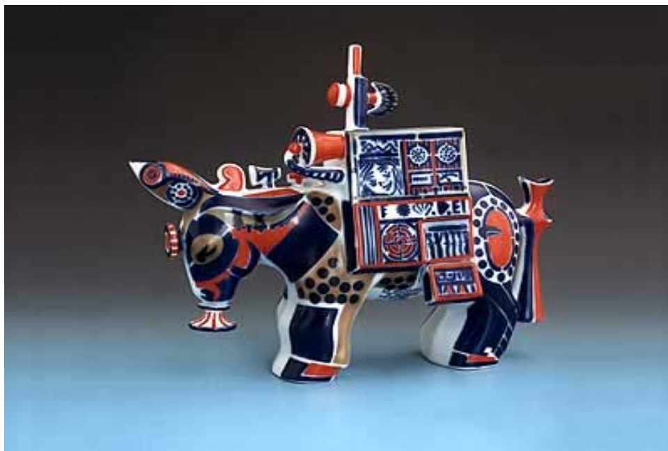
Imagen 10: Figura de burro con el color rojo