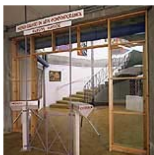
Imagen 17: Entrada