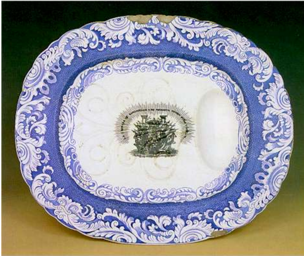
Imagen 5: Fuente vajilla de Isabel II Palacio Real Madrid