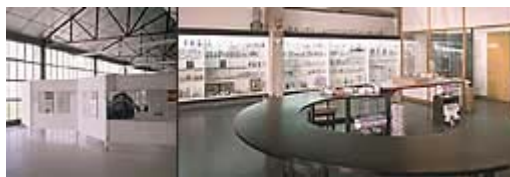
Imagen 7: Galería de ventas de la fábrica

El complejo industrial de Cerámicas do Castro, fundado por Isaac Díaz Pardo, se abrió en el año 1949, está situado en el Castro de Samoedo (Sada A Coruña). Al principio se limitaba a hacer series muy limitadas originales de artistas,