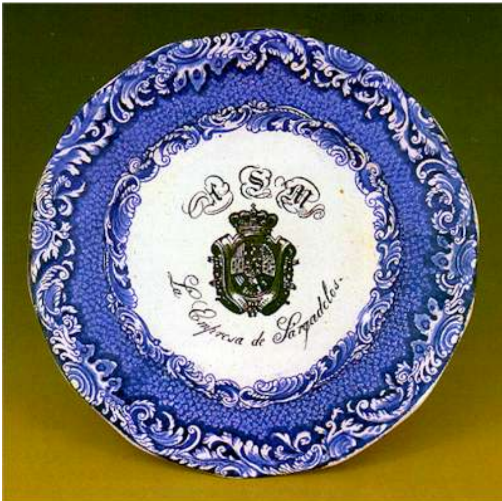
Imagen 6: Plato vajilla de Isabel II