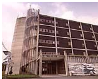
Imagen 8: Nueva fábrica

utilizando únicamente tierra gallega, pues su idea al abrir esta fábrica era explotar los depósitos de caolín de Sargadelos de la que se obtiene una pasta fina y translúcida de gran dureza y blancura.