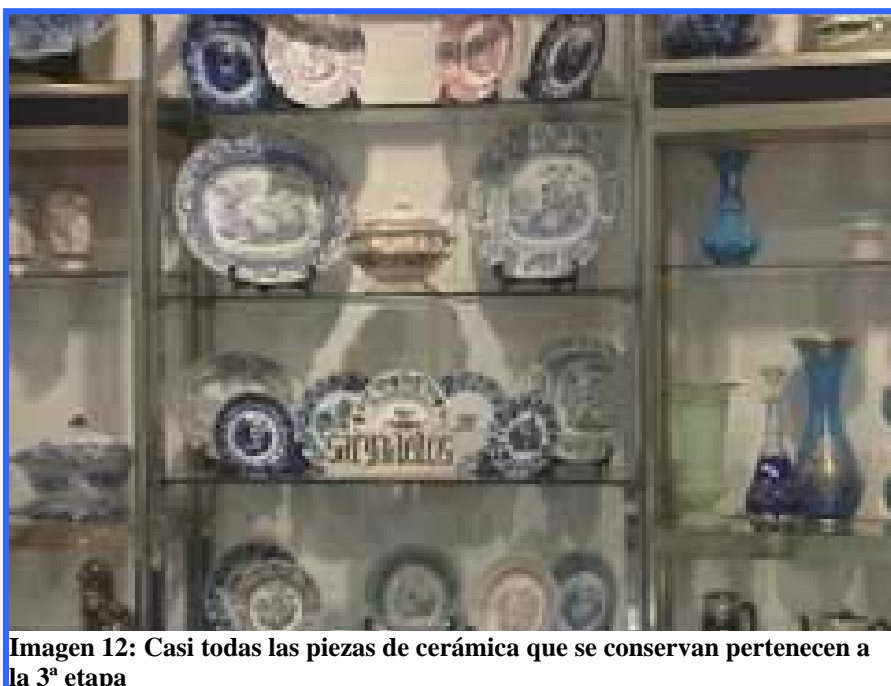
Imagen 12: Casi todas las piezas de cerámica que se conservan pertenecen a la 3ª etapa

En el Museo se conservan piezas de fundición y moldes originales de la Antigua Fábrica en él que hay una exposición permanente de cerámica española y una de la propia empresa, donde están representadas las distintas épocas de Sargadelos con piezas de cerámica, grabados, escultura y pintura.